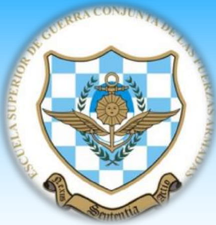
Escuela Superior de Guerra Conjunta