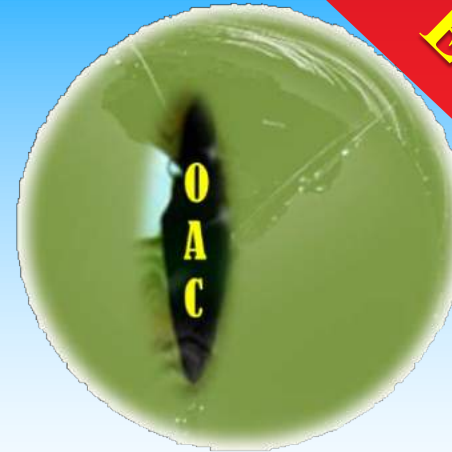
Observatorio Argentino del Ciberespacio